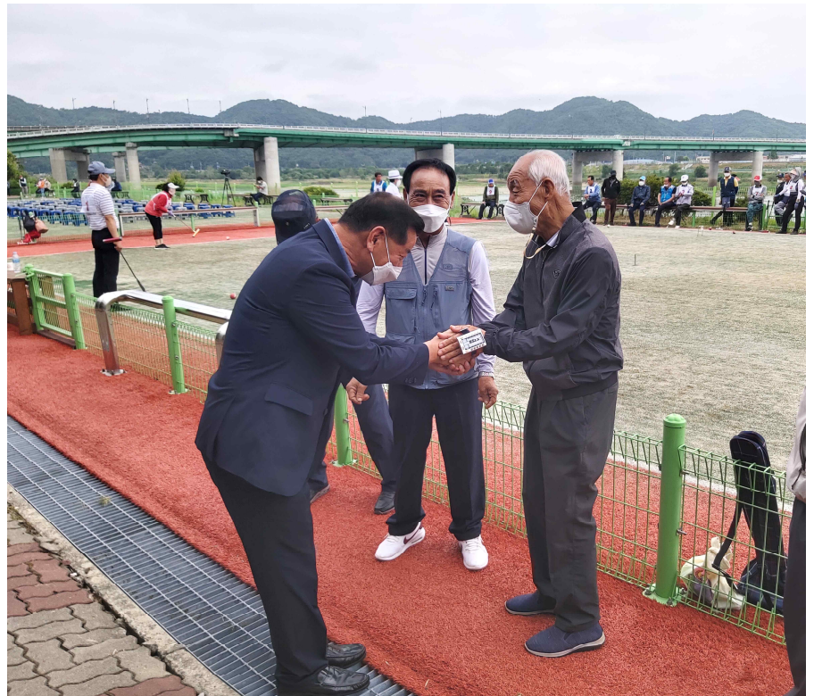
공주시장 당선인 시민과의 만남(2022.6.10.)