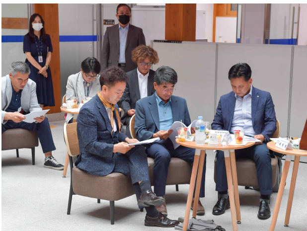
인수위 운영결과 종합보고(2022.6.29.)