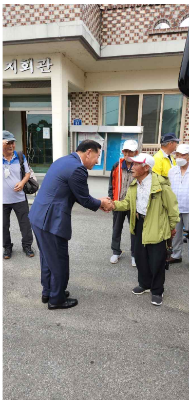
공주시장 당선인 시민과의 만남(2022.6.16.)