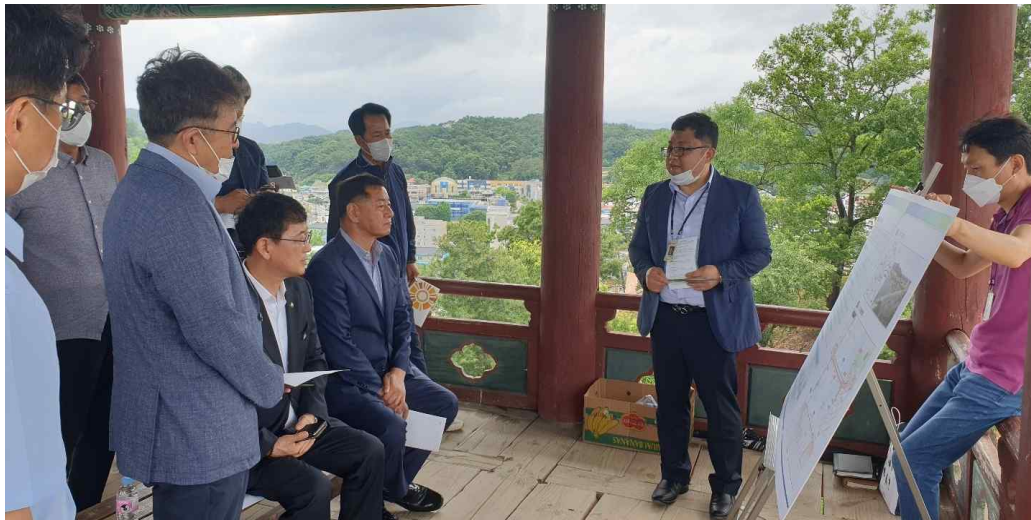
공주시장 당선인 사업현장방문 (2022.6.29.)