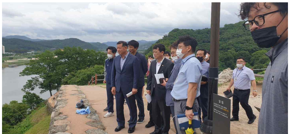
공주시장 당선인 사업현장방문 (2022.6.29.)