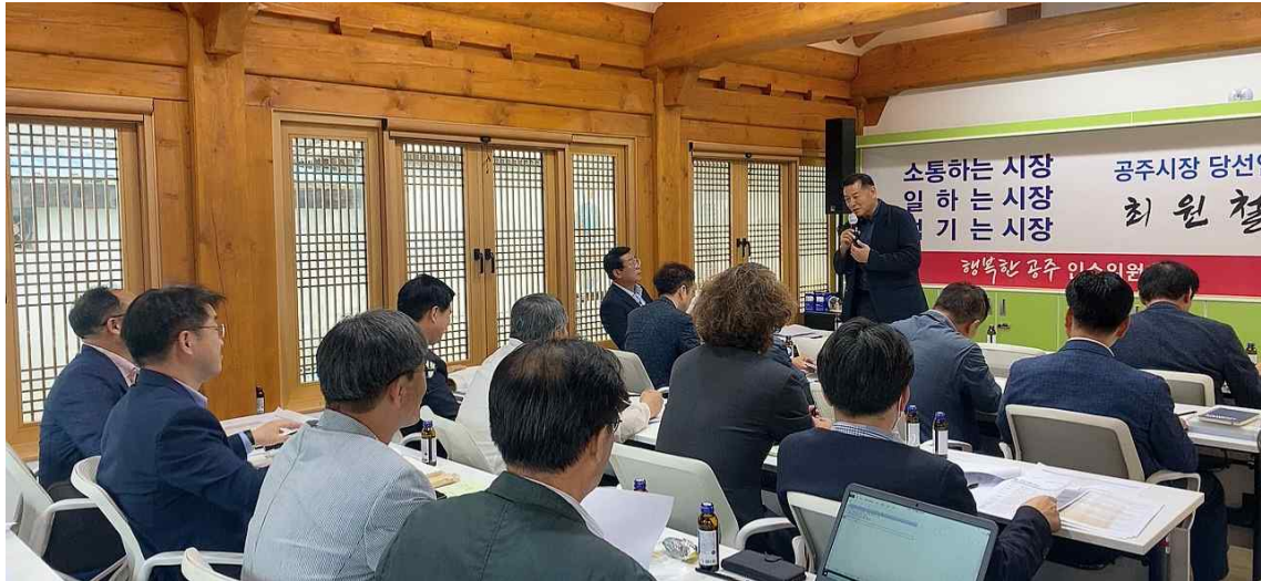
제10대 공주시장직 인수위원회 대상 안내(2022.6.8.)