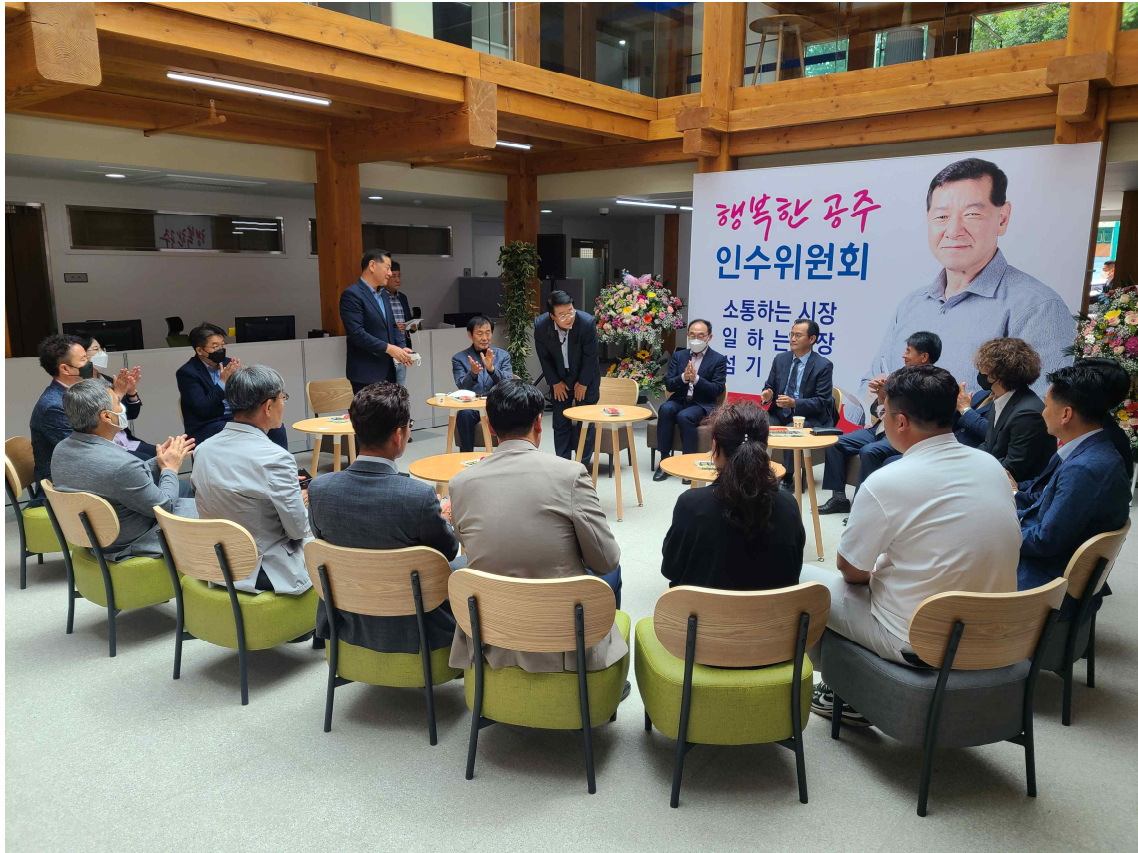
제10대 공주시장직 인수위원회 상견례(2022.6.8.)