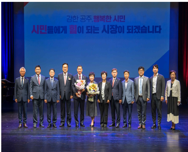
제10대 공주시장 취임식 기념촬영 (2022.7.1.)