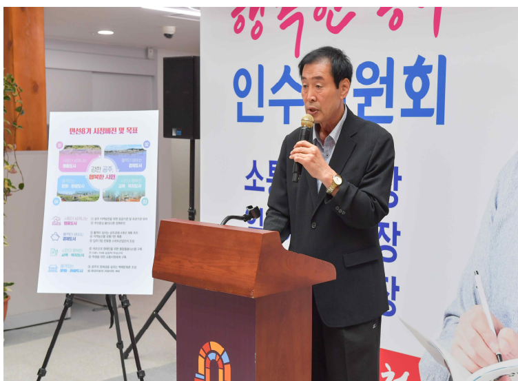
인수위 운영결과 종합보고(2022.6.29.)