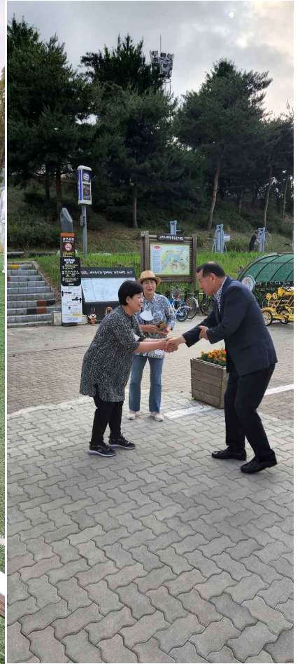
공주시장 당선인 시민과의 만남(2022.6.10.)