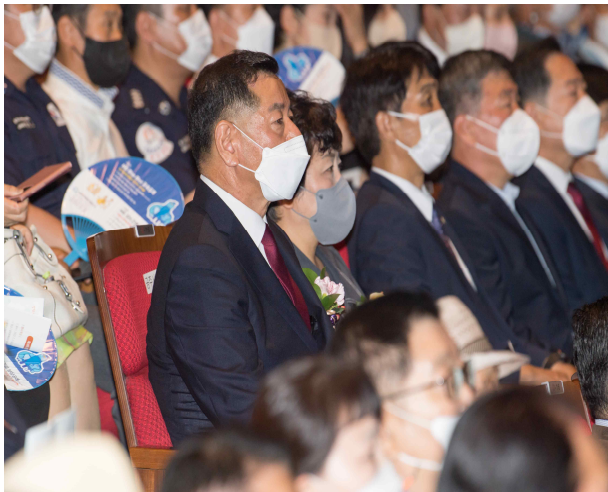
제10대 공주시장 취임식 (2022.7.1.)