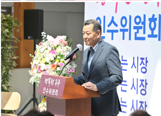
제10대 공주시장직 인수위원회 개소식(2022.6.8.)