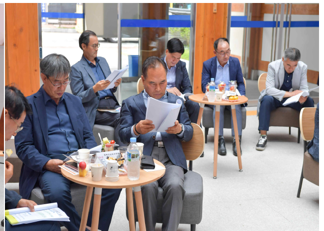
인수위 운영결과 종합보고(2022.6.29.)