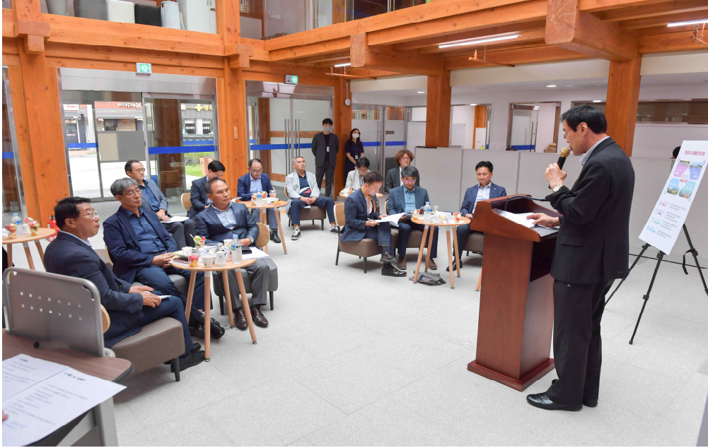
인수위 운영결과 종합보고(2022.6.29.)