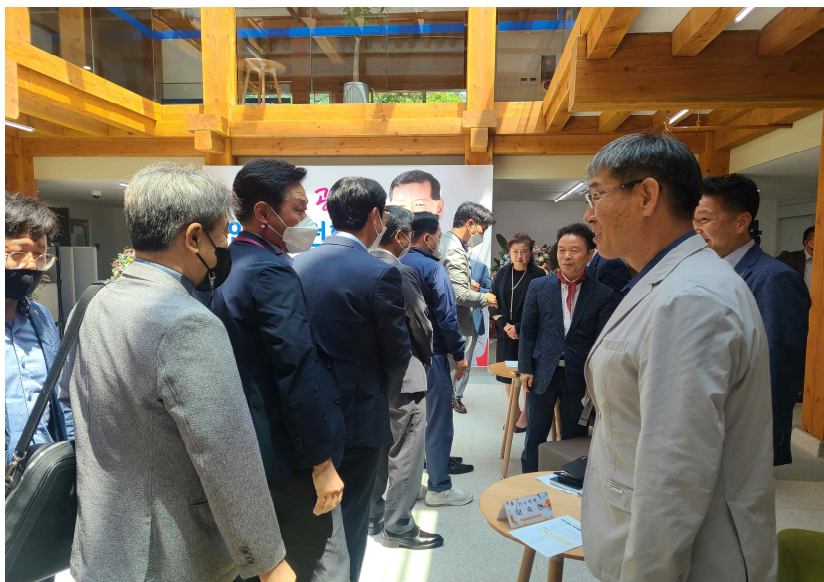
인수위원회 - 시 간부공무원 만남(2022.6.8.)