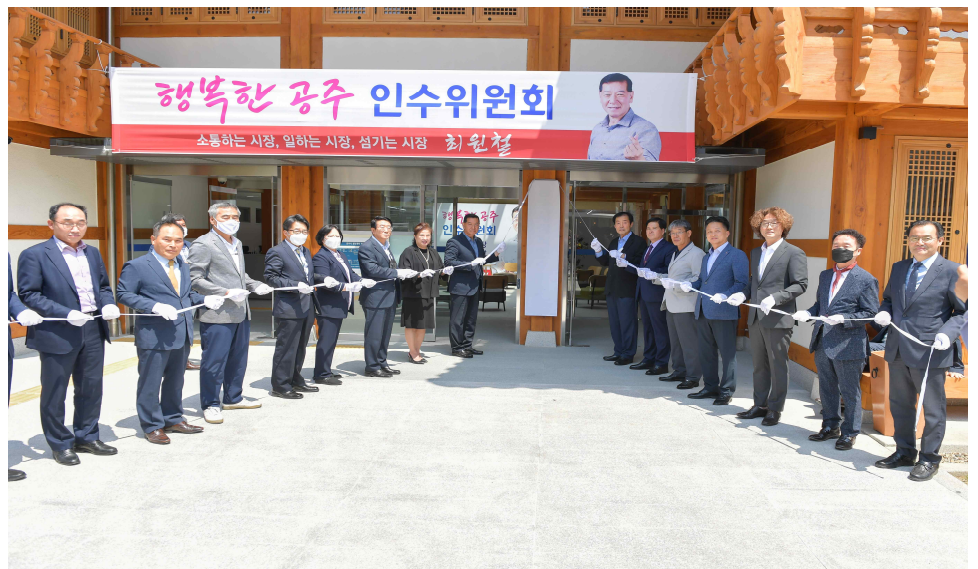
제10대 공주시장직 인수위원회 현판식(2022.6.8.)