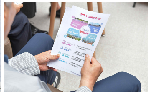
인수위 운영결과 종합 보고서(2022.6.29.)