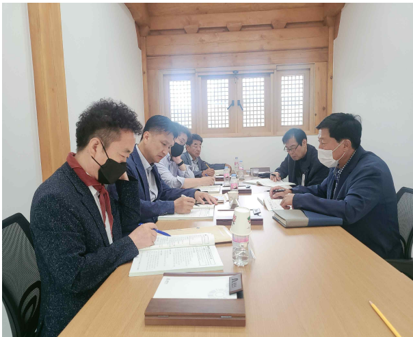
자치행정분과 주요업무 보고회(2022.6.13.)