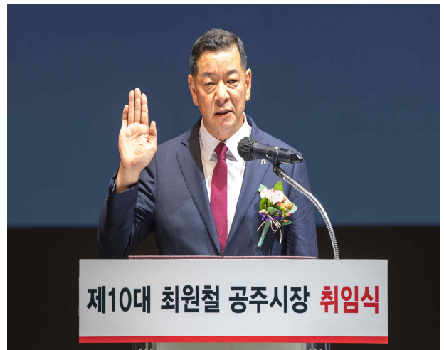
제10대 공주시장 취임사 (2022.7.1.)