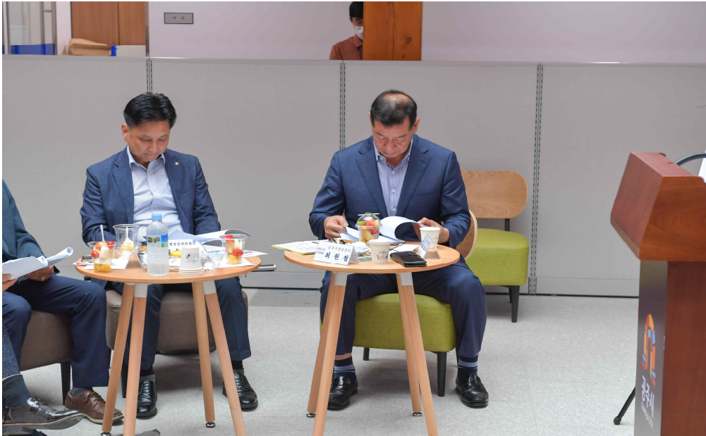
인수위 운영결과 종합보고(2022.6.29.)