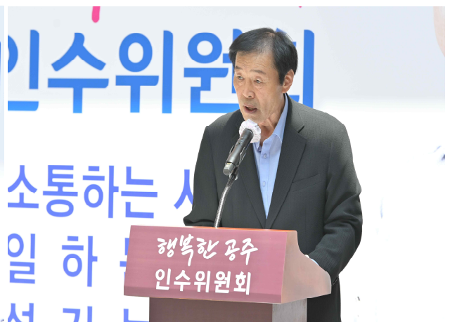
제10대 공주시장직 인수위원회 개소식(2022.6.8.)