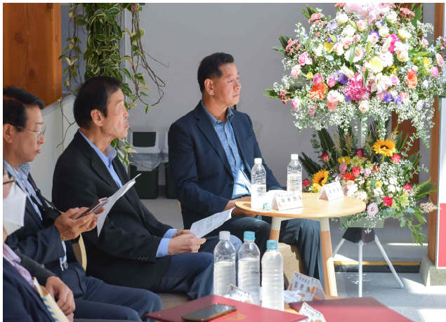
제10대 공주시장직 인수위원회 상견례(2022.6.8.)