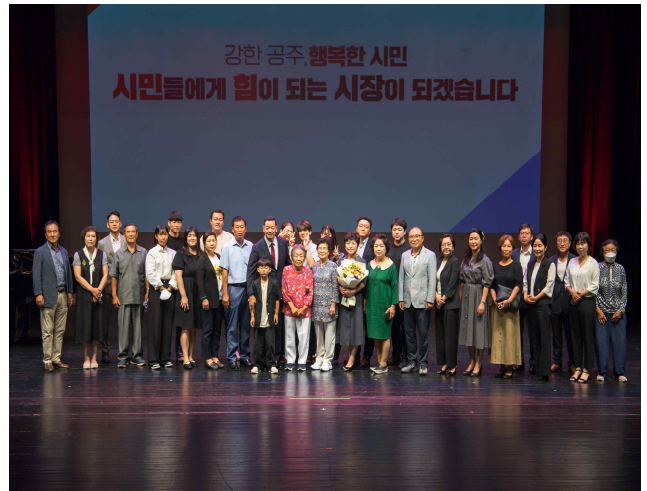
제10대 공주시장 취임식 기념촬영 (2022.7.1.)