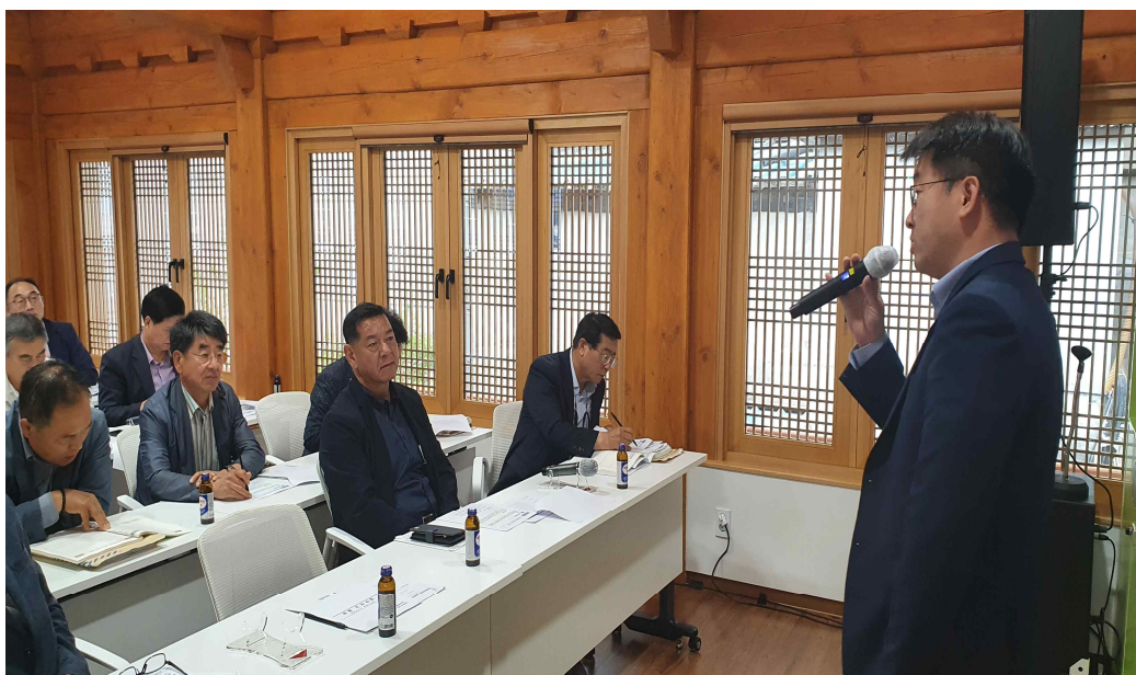
인수위 전체회의 (2022.6.15.)