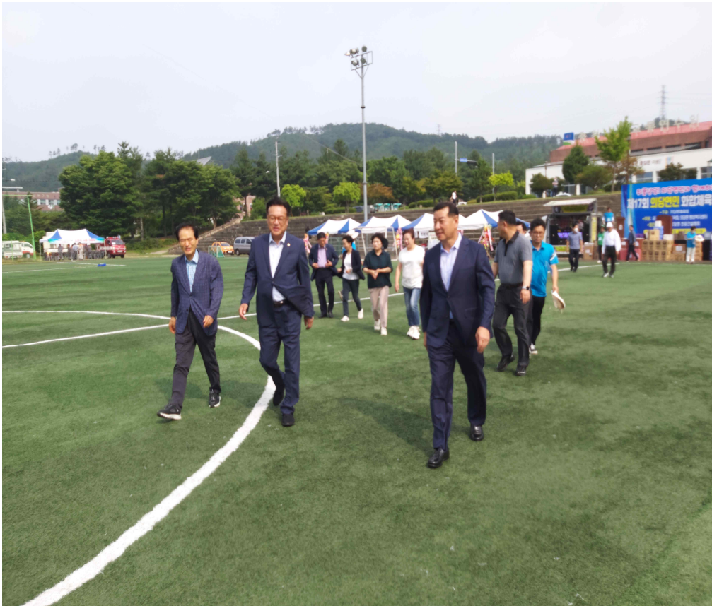
공주시장 당선인 의당 면민 화합체육대회 방문 (2022.6.25.)