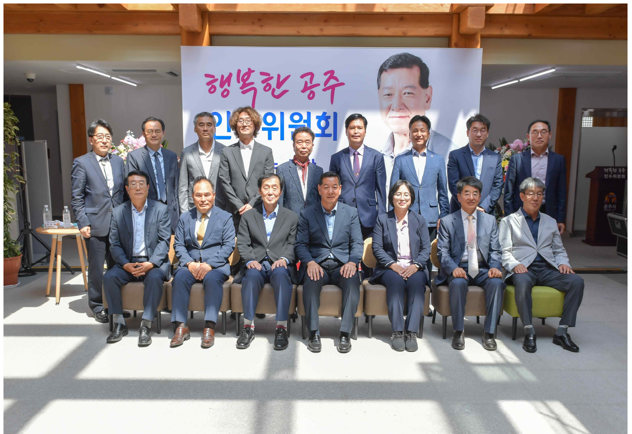
제10대 공주시장직 인수위원회(2022.6.8.)