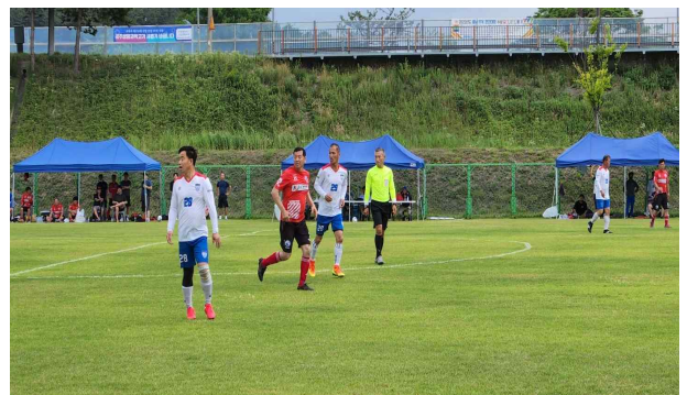
공주시장 당선인 축구대회 참가(2022.6.26.)