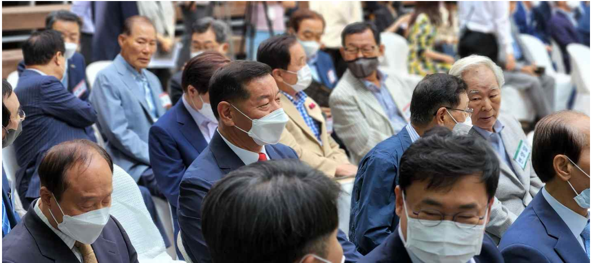
공주시장 당선인 서울 출장(2022.6.21.)