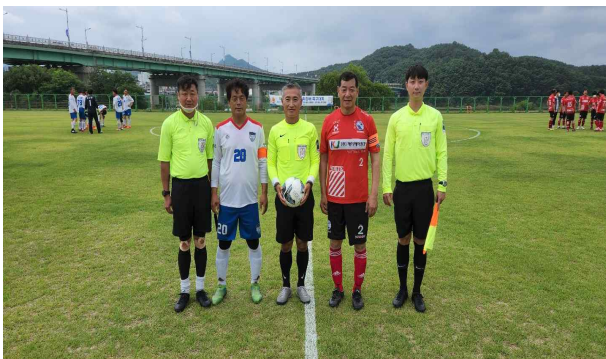
공주시장 당선인 축구대회 참가(2022.6.26.)