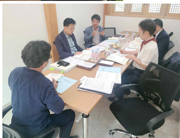
자치행정분과 평생교육과 추가 논의(2022.6.22.)