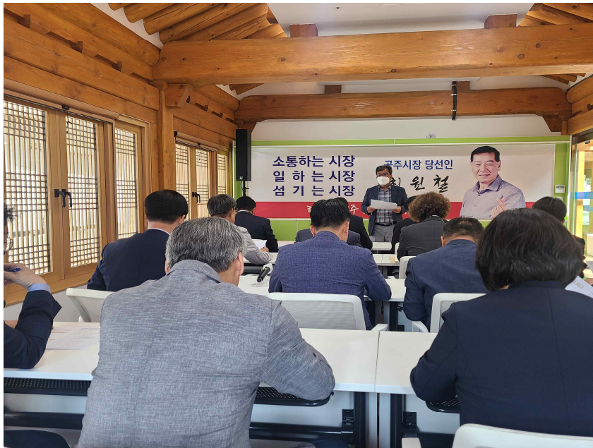
제10대 공주시장직 인수위원회 대상 안내(2022.6.8.)