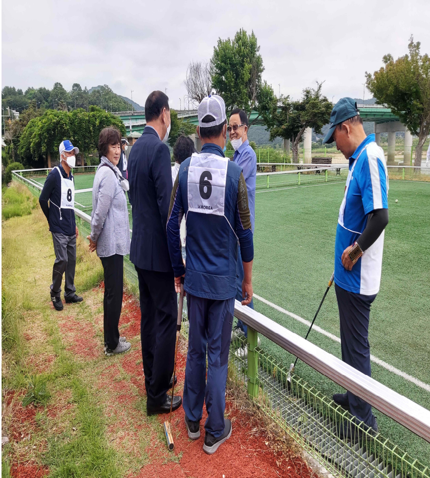
공주시장 당선인 시민과의 만남(2022.6.8.)