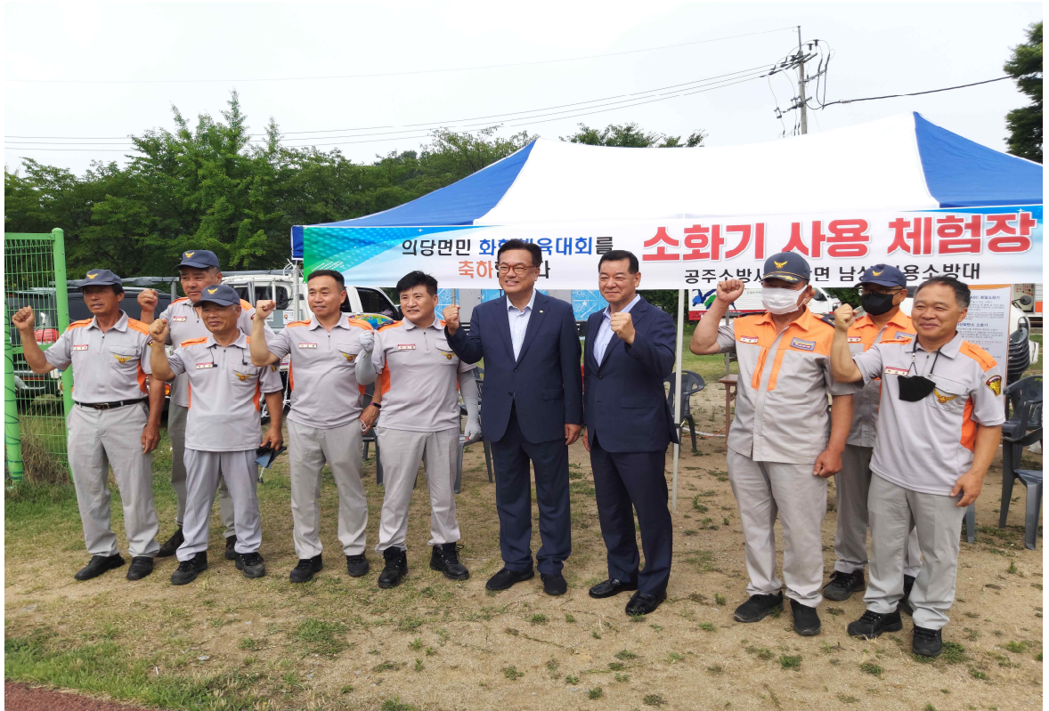
공주시장 당선인 의당면민 화합체육대회 방문(2022.6.25.)