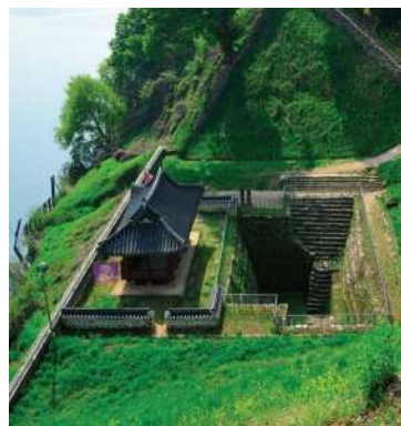
연지 및 만하루