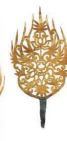
왕비금제관장식 [국보 제155호]