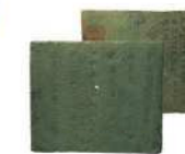
묘지석 [국보 제163호]