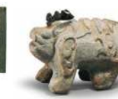
석수 [국보 제162호]