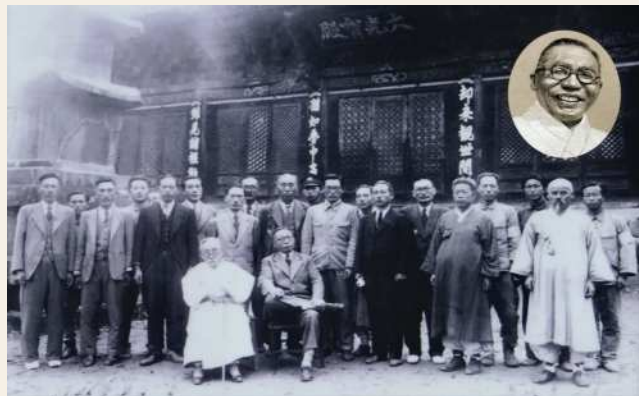
1946년 마곡사 방문

백범 김구선생은 1898년 마곡사를 떠난후, 근 50년 만에 돌아와 대광보전 기둥에 걸려있는 주련의 却來觀世間 猶如夢中事(각래관세간 유여몽중사: 돌아와 세상을 보니 마치 꿈 가운데 일 같구나)라는 능엄경에 나오는 문구를 보고 감개무량하여 그때를 생각하며 한그루의 향나무를 심어 놓았는데, 지금도 백범당 옆에 푸르게 자라고 있다.