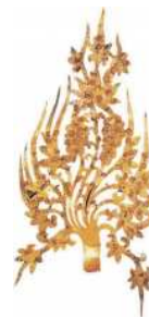
왕금제관장식 [국보 제154호]

무령왕릉은 백제 25대 무령왕과 왕비의 무덤으로 1971년 배수로 공사 중 우연히 발견되었는데, 이는 피장자의 신분을 알 수 있는 한국 고대의 유일한 왕릉으로 1,500년 전의 화려하고 세련된 미의식, 수준 높은 공예 기술을 통해 찬란한 백제문화를 엿볼 수 있다.