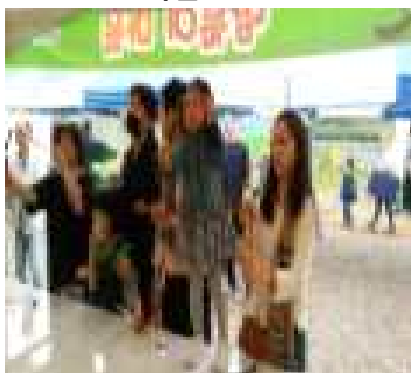
<알밤 새충쏘기 체험>